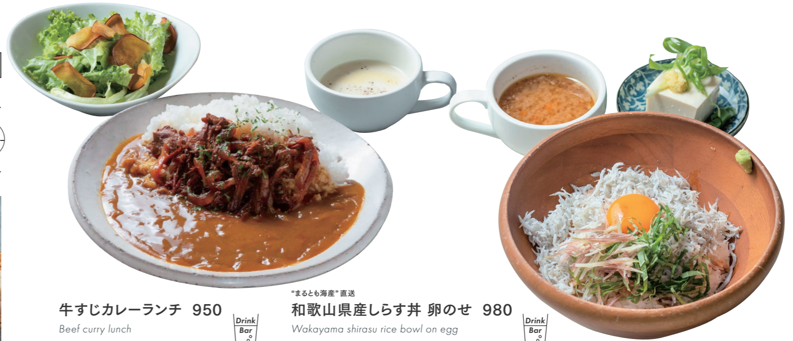
牛すじカレーランチ 950 Beef curry lunch [スープ / サラダ / ドリンクバー]