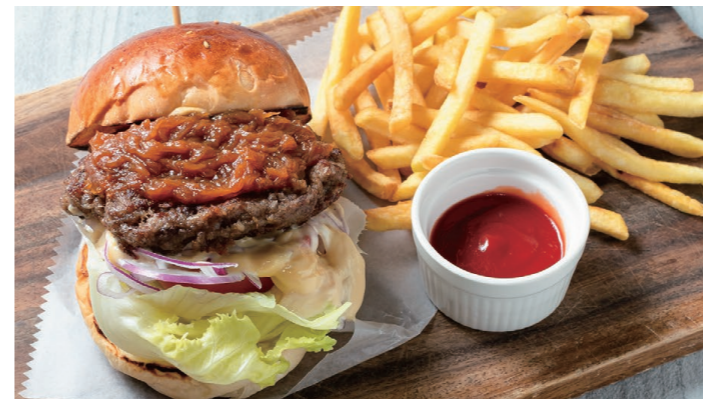
カレンダーハンバーガーランチ 1400 Calendar Hamburger lunch [フライドポテト / ドリンクバー]