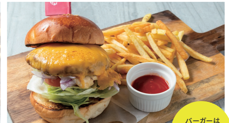
チーズバーガーランチ 1500 Cheese Hamburger lunch [フライドポテト / ドリンクバー]