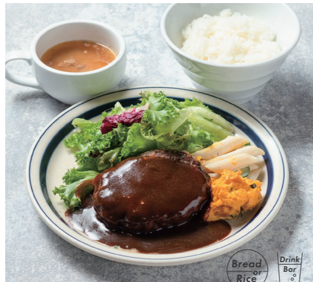
ハンバーグランチ 1250 Hamburger Steak lunch [1209] [スープ / パン or ライス / ドリンクバー]