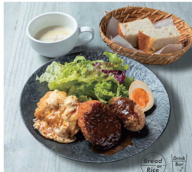
チキン南蛮 & コロッケランチ 980 Chicken namban and croquette lunch [スープ / パン or ライス / ドリンクバー]