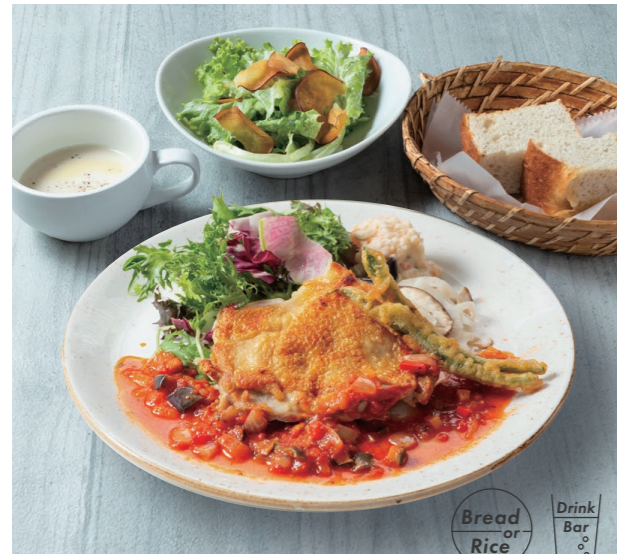
日替わりランチ 950 Daily lunch [スープ / パン or ライス / ドリンクバー] *詳しいメニューはレジ横にて。