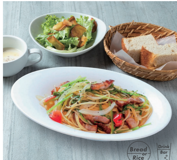
パスタランチ 950 Pasta lunch [スープ / パン / サラダ / ドリンクバー] *詳しいメニューはレジ横にて。