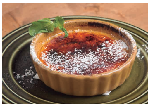
クレームブリュレ 600 Crème brûlée

オーダーが入ってから表面を焼き上げる、 パリパリ食感と濃厚なカスタードが絶妙です!