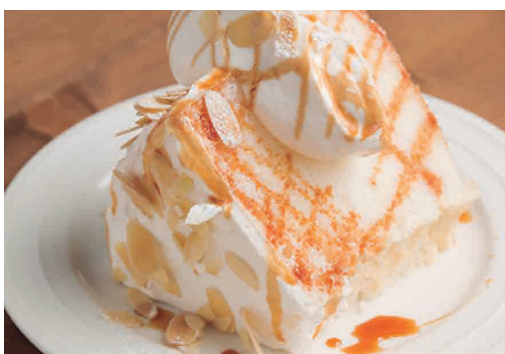
エンゼルフードケーキ バニラキャラメル 600 Angel Food Cake Vanilla Caramel

しっかり焼き上げたキャラメルのような味わいと 濃厚でクリーミーな大人のチーズケーキ!