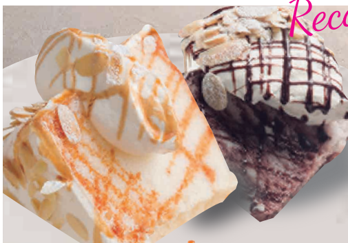
エンゼルフードケーキ キャラメル&ショコラ 660 Angel Food Cake Vanilla Caramel & Chocolate