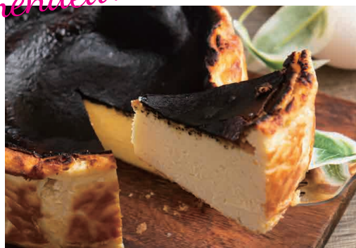
バスクチーズケーキ 700 Basque Cheese Cake

しっかり焼き上げたキャラメルのような味わいと 濃厚でクリーミーな大人のチーズケーキ!