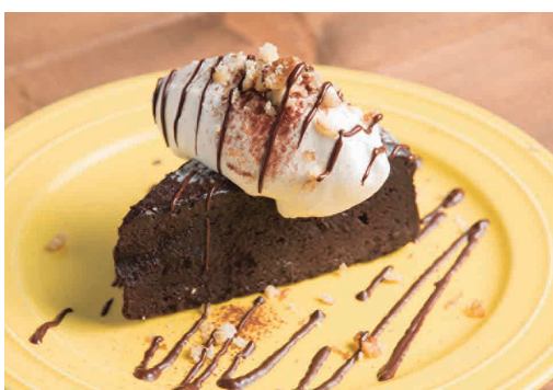
ガトーショコラ 650 Gâteau au chocolat

しっとりモチモチとしたショコラケーキ。 たっぷりのクリームとチョコレートソースで!