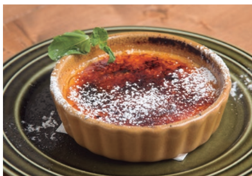
クレームブリュレ 600 Crème brûlée

オーダーが入ってから表面を焼き上げる、 パリパリ食感と濃厚なカスタードが絶妙です!