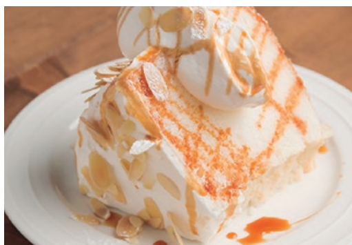
エンゼルフードケーキ バニラキャラメル 600 Angel Food Cake Vanilla Caramel

しっかり焼き上げたキャラメルのような味わいと 濃厚でクリーミーな大人のチーズケーキ!