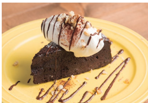
ガトーショコラ 650 Gâteau au chocolat

しっとりモチモチとしたショコラケーキ。 たっぷりのクリームとチョコレートソースで!