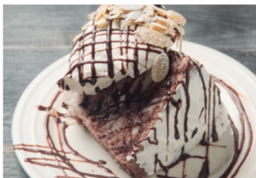
エンゼルフードケーキ ショコラ 600 Angel Food Cake Vanilla Chocolate

バニラ風味のしっとりモチモチのケーキ。 キャラメルソースが相性抜群の美味しさです!