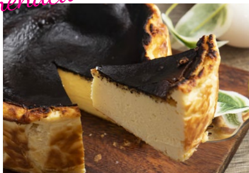
バスクチーズケーキ 700 Basque Cheese Cake

しっかり焼き上げたキャラメルのような味わいと 濃厚でクリーミーな大人のチーズケーキ!